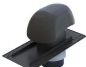
C Ebene Grundplatte