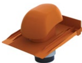
B Universelle Grundplatte mit langer Schürze